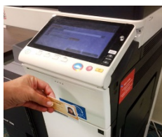
Přihlášení pomocí ISIC